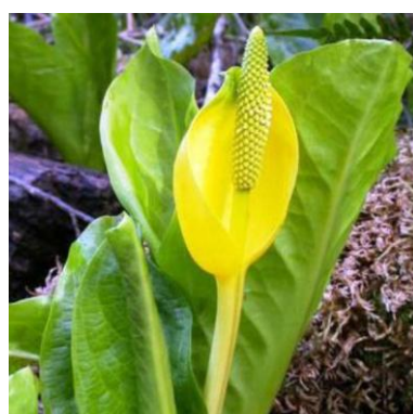
Moeraslantaarn Lysichiton americanus