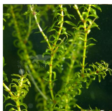
Smalle waterpest Elodea nuttallii