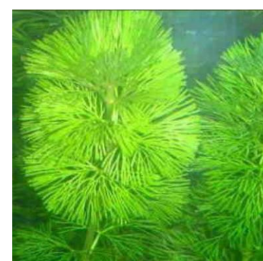
Waterwaaier Cabomba caroliniana