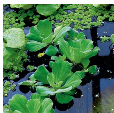
Watersla Pistia stratiotes