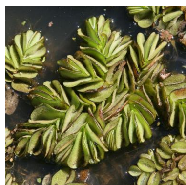
Grote vlotvaren Salvinia molesta