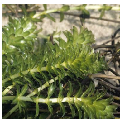
Hydrilla Hydrilla verticillata