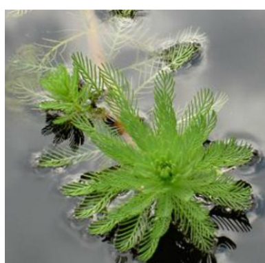
Parelvederkruid Myriophyllum aquaticum