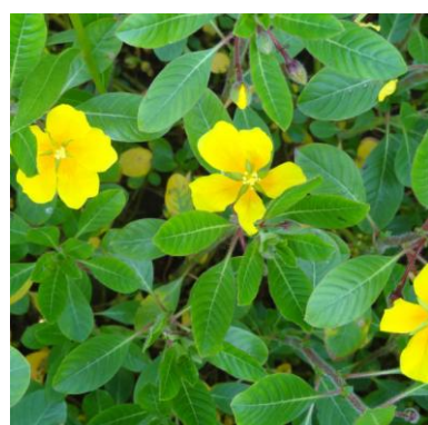
Kleine waterteunisbloem Ludwigia peploides