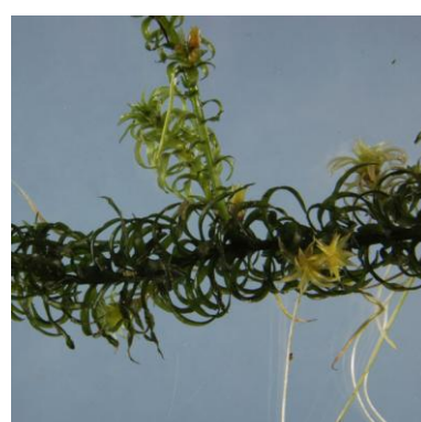
Verspreidbladige waterpest Lagorosiphon major