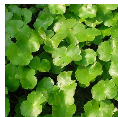
Grote waternavel Hydrocotyle ranunculoides