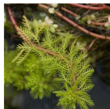
Ongelijkbladig vederkruid Myriophyllum heterophyllum