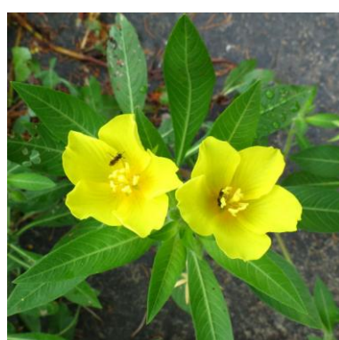
Waterteunisbloem Ludwigia grandiflora