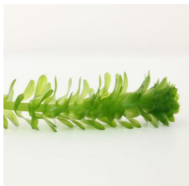
Egeria Egeria densa

Deze planten kunnen flink woekeren (= snel groeien en zich verspreiden).