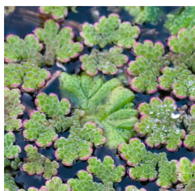
Grote kroosvaren Azolla filiculoides