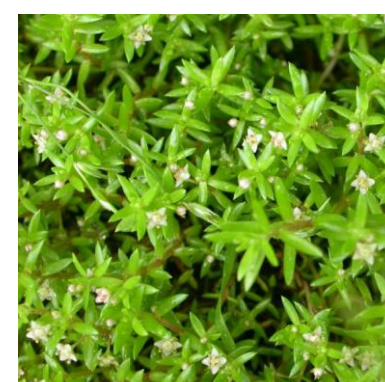
Watercrassula Crassula helmsii